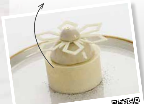
Le Flocon à la Vanille Tahitensis et Noisette du Piémont