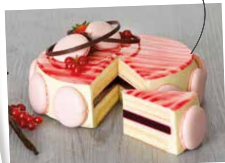
Suprême à la Vanille et aux Fruits Rouges

Crème pâtissière, diplomate, chantilly et punch à la vanille