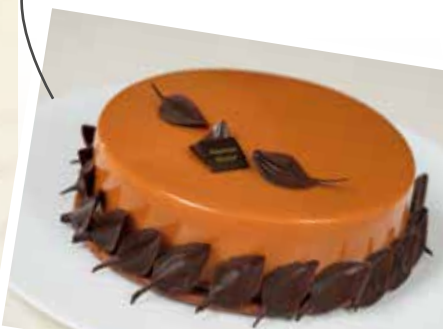
Entremets Caramélisé à la Vanille Tahitensis

Crèmeux, pâte sablée et glaçage à la vanille