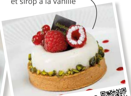
Déllice de Bourgogne et à la Vanille Tahitensis