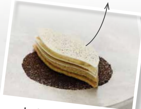
La Feuille à la Vanille Tahitensis

Sablé, biscuit, crèmeux, caramel à la vanille