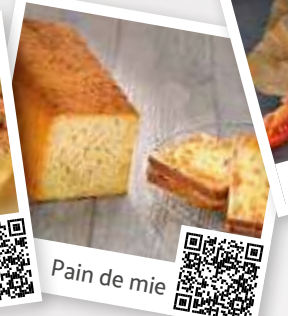
Pain de mie