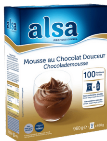
Mousse au Chocolat Douceur

Se personnalise avec les sauces dessert alsa Professionnel : fraises, framboises, mangue-abricot.