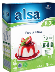
Panna Cotta Bio

Bonne conservation des crèmes au frais : 48 h.